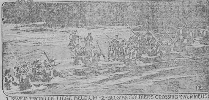
1. RIVER FRONT OF LIEGE, BELGIUM - 2. BELGIAN SOLDIERS CROSSING RIVER MEUSE

Parte del río frente a Lieja, cuyas casas fueron incendiadas por las granadas que llovían sobre la ciudad, durante la sangrienta batalla que marcó el avance de los alemanes al través de Bélgica, con rumbo a la frontera francesa. Lieja es una bonita ciudad con edificios que en su mayor parte son de un interesante estilo arquitectónico. La ciudad era industrial y el desastre que hoy la aflige se hará sentir muchos años después de que la vida pública vuelva a su estado normal. Los turistas de todo el mundo que han visitado Lieja se han sentido atraídos por su belleza. Los soldados belgas han dado una sorpresa al universo con su decidida resistencia a los alemanes. Son buenos tiradores y no desperdician sus municiones. Ellos saben que están combatiendo por la autonomía de su territorio y ponen de su parte todo el coraje posible para la lucha.