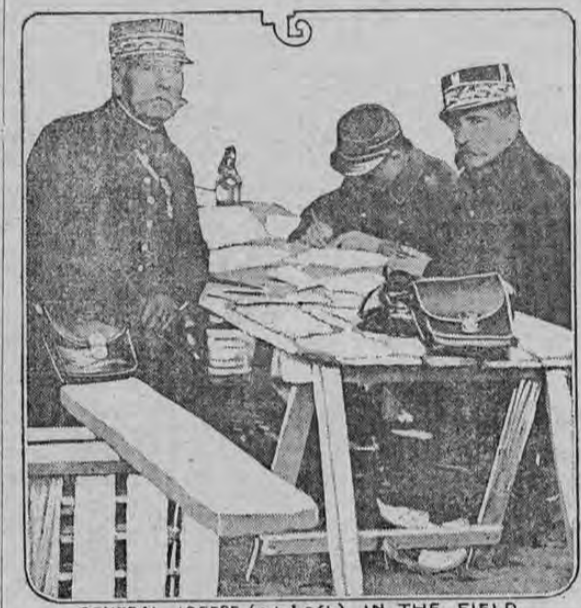
GENERAL JOFFRE (at Left) IN THE FIELD

LONDRES, 27.—Noticias de Ostende, del martes, dicen que el Alcalde de Lille emitió una proclama anunciando la evacuación de la ciudad, que se desarmaron a los gendarmes, que se tomaron medidas para la entrega, sacándose los tesoros. Se asegura que no había grandes fuerzas de los aliados por detener la marcha de los alemanes sobre Lille. El barco pesquero "Norten", trajo a Schields al Capitán y a otros tripulantes más del "Gottfree". Los tripulantes del "Nosden" dicen que se alarman muchísi-